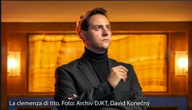
La clemenza di tito

Handlung aus Rom des Jahres 79 n. Chr. in den Hintergrund treten lässt, wird sie bis heute auf Opernbühnen in aller Welt gespielt. Mit dieser Premiere zahlt die DJKT-Oper ihre Schuld gegenüber einem großen Komponisten zurück, von dessen umfangreichen Opernwerken viele hier noch nicht aufgeführt wurden. Die Oper in der italienischen Originalfassung mit tschechischen und deutschen Untertiteln wird von Rocc inszeniert, um die musikalische Inszenierung wird sich Michael Hofstetter kümmern, und das Publikum wird ihre Klänge am 27. Januar 2024 erstmals im Zuschauerraum des Großen Theaters hören.