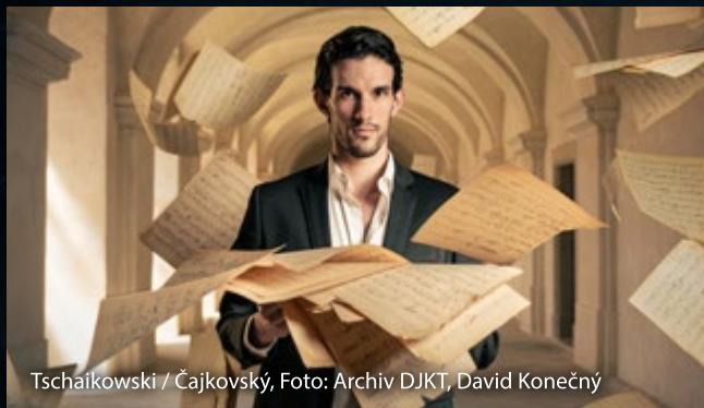
Tschaikowski / Čajkovský

Čajkovského, tvůrce hudebního romantismu, po celém světě proslavila vedle množství úspěšných oper zejména trojice klasických baletů – Labutí jezero, Spící krasavice a Louskáček. Balet DJKT nám nyní, v roce 2023, svojí inscenací připomene 130 let od skladatelova úmrtí. Světová premiéra s živým orchestrem pod taktovkou šéfa plzeňské opery Jiřího Petrdlíka se odehraje ve Velkém divadle 18. listopadu 2023.