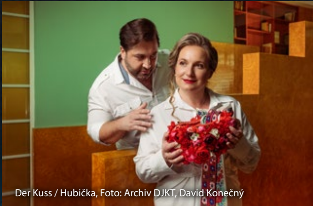
Der Kuss / Hubička

spor o hubičku, kterou Lukášovi Vendulka z úcty k jeho mrtvé ženě nechce dát dřív, než budou svoji. Nakonec se obě „tvrdé hlavy“ usmíří a v závěru opery si padnou do náručí. Premiéra plzeňské inscenace v režii Magdaleny Švecové a hudebním nastudování Jiřího Petrdlíka se odehraje 27. dubna 2024 ve Velkém divadle. Uvádíme s německými titulky.