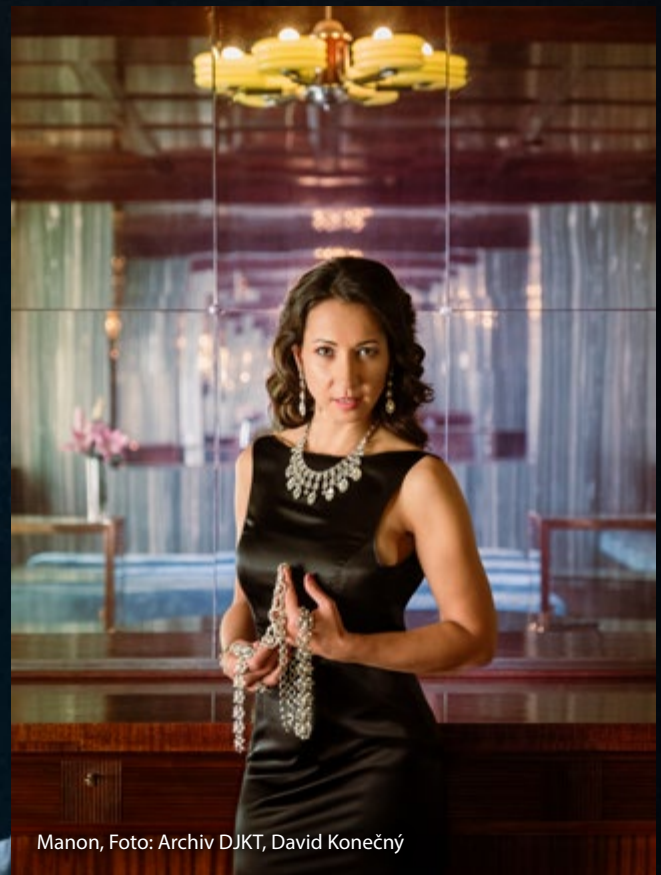
Manon