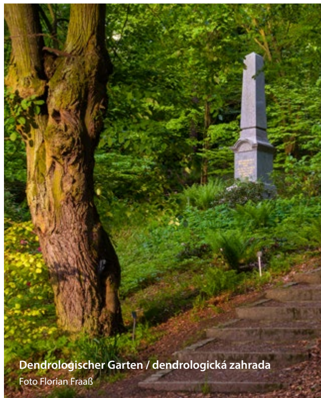
Dendrologischer Garten / dendrologická zahrada

Můžete se zde kochat přírodou, a především na sebe nechat působit její hluboký klid. Nádherná rozmanitost spojená s autentickým požitkem z přírody a možnost zastavit se poté na jídlo v četných hostincích v okolí náměstí dělají z návštěvy Bad Bernecku nezapomenutelný zážitek.